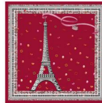
Carré de soie 50 x50 – 5 coloris Pour 150 pièces : Prix remisé unitaire 48,75 € HT

Amenez partout avec vous le chic et l'élégance à la française.