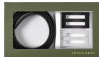
Coffret ceinture – coloris noir/marine Pour 100 pièces : Prix remisé unitaire 91,00 € HT