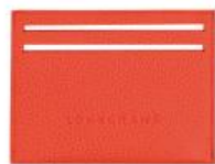
Porte-cartes – 6 coloris Pour 100 pièces : Prix remisé unitaire 42,00 € HT

Un nouveau souffle pour ces lignes mythiques de la Maison. Nouvelles formes et nouveaux coloris pour créer un véritable concentré d'optimisme.