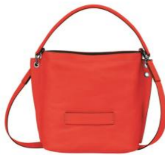
Sac bandoulière S – 6 coloris Pour 50 pièces : Prix remisé unitaire 351,00 € HT