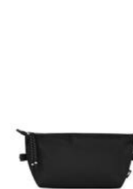
Trousse de toilette – coloris noir Pour 100 pièces : Prix remisé unitaire 66,00 € HT