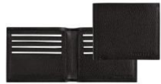
Portefeuille – coloris noir Pour 100 pièces : Prix remisé unitaire 61,75 € HT

Des modèles pratiques, modernes et intemporels qui permettent à l'homme curieux et rêveur de s'échapper dès qu'il le souhaite.