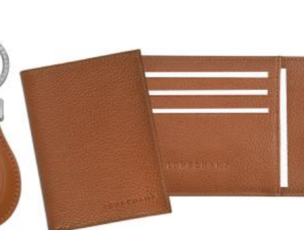
Porte-cartes – 3 coloris Pour 100 pièces : Prix remisé unitaire 49,00 € HT