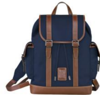
Sac à dos – 3 coloris Pour 50 pièces : Prix remisé unitaire 227,50 € HT