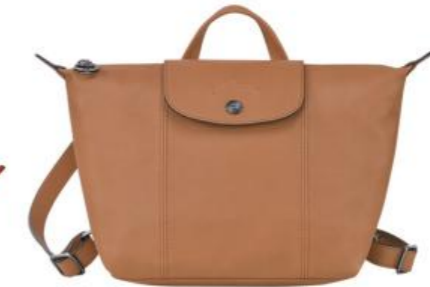
Sac à dos – 6 coloris Pour 100 pièces : Prix remisé unitaire 216,00 € HT