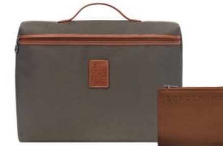
Porte-documents – 3 coloris Pour 100 pièces : Prix remisé unitaire 65,00 € HT