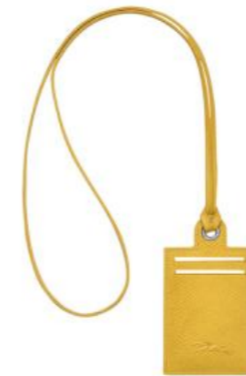
Porte-cartes – 4 coloris Pour 150 pièces : Prix remisé unitaire 48,75 € HT