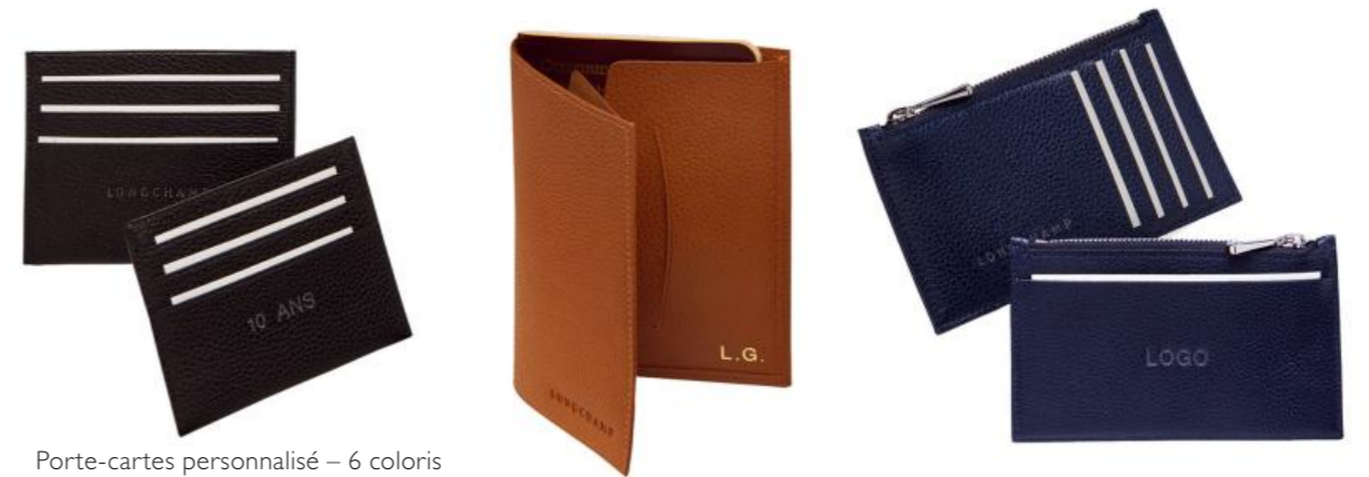
Porte-cartes personnalisé – 6 coloris Pour 200 pièces avec marquage : Prix remisé unitaire 46,25 € HT

Des produits personnalisés pour une attention supplémentaire.