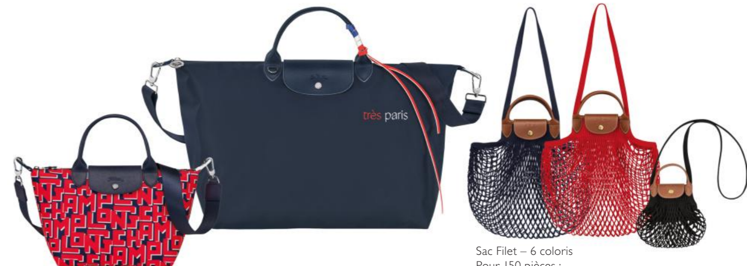
Sac Filet – 6 coloris Pour 150 pièces : Prix remisé unitaire 58,50 € HT