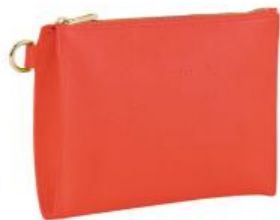
Pochette – 7 coloris Pour 150 pièces : Prix remisé unitaire 52,00 € HT