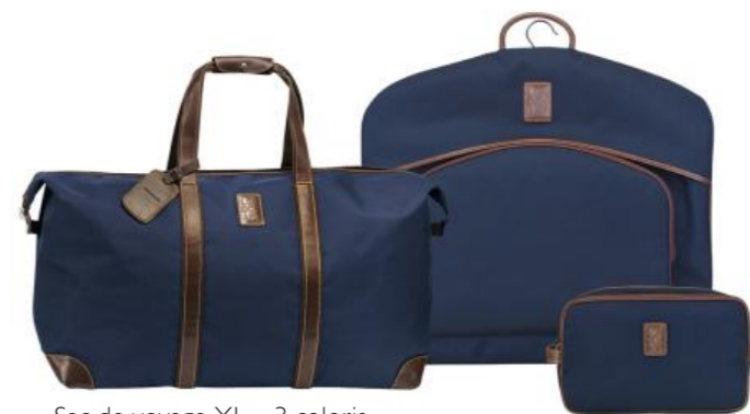
Sac de voyage XL – 3 coloris Pour 50 pièces : Prix remisé unitaire 182,00 € HT