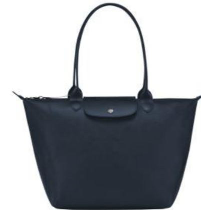
Sac shopping L – 4 coloris Pour 200 pièces : Prix remisé unitaire 114,00 € HT

Des formats astucieux et combinables, des couleurs sobres ou avec une touche de pep's : des sacs et des accessoires qui s'adaptent à votre quotidien.