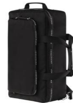
Sac de voyage – coloris noir Pour 100 pièces : Prix remisé unitaire 240,00 € HT