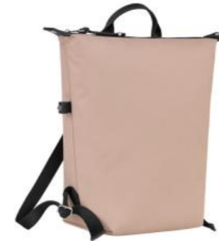
Sac à dos – 4 coloris Pour 50 pièces : Prix remisé unitaire 149,50 € HT

Soucieuse de son impact sur l'environnement, la Maison Longchamp est en recherche constante de matières plus vertueuses dans leur composition et leur élaboration.