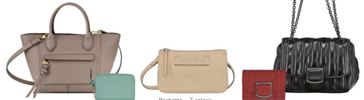
Pochette – 7 coloris Pour 50 pièces : Prix remisé unitaire 201,50 € HT