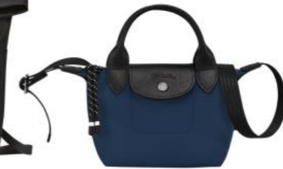
Sac porté main XS – 4 coloris Pour 70 pièces : Prix remisé unitaire 104,00 € HT