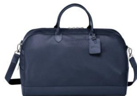
Sac de voyage L – 3 coloris Pour 100 pièces : Prix remisé unitaire 390,50 € HT