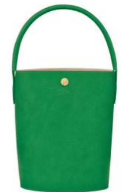
Sac seau – 6 coloris Pour 100 pièces : Prix remisé unitaire 175,50 € HT