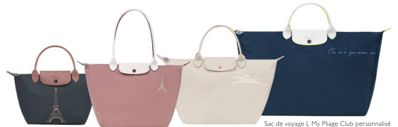
Sac de voyage L My Plage Club personnalisé Pour 100 pièces : Prix remisé unitaire 117,00 € HT