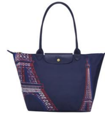
Sac shopping L – coloris unique Pour 100 pièces : Prix remisé unitaire 68,25 € HT