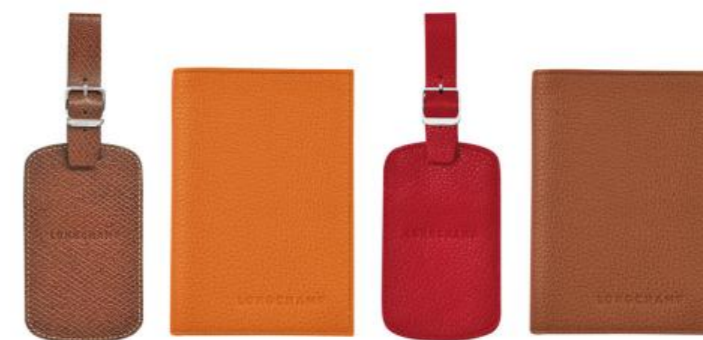
Étui passeport – 7 coloris Pour 150 pièces : Prix remisé unitaire 45,50 € HT