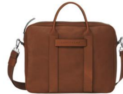
Porte-documents – coloris cognac Pour 50 pièces : Prix remisé unitaire 504,00 € HT

Vos essentiels du quotidien alliant style, savoir-faire maroquinier et praticité.