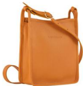
Sac porté-travers – 8 coloris Pour 50 pièces : Prix remisé unitaire 188,50 € HT